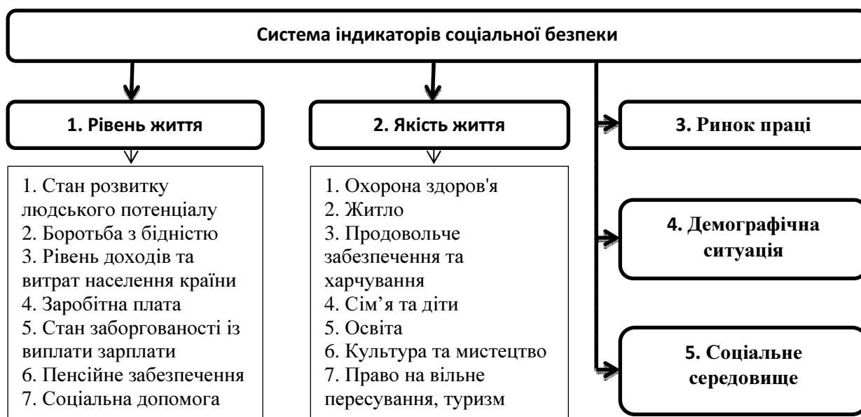
Рис. 3. Система індикаторів соціальної безпеки.

Центр перспективних соціальних досліджень Міністерства праці та соціальної політики України та НАН України пропонує систему індикаторів соціальної безпеки з наступними блоками (рис. 3):