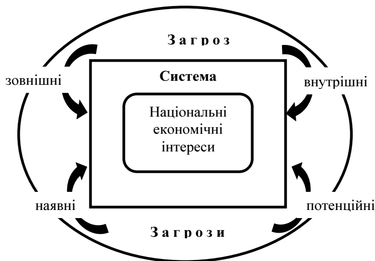
Рис. 1. Логіко-структурна схема категорії «економічна безпека»

Економічна безпека — це такий стан національної економіки, який дає змогу зберігати стійкість до внутрішніх та зовнішніх загроз і здатний задовольняти потреби особи, сім'ї, суспільства та держави [9]. Отже, змістовним ядром поняття «економічна безпека» є зіставлення «національні економічні інтереси — загрози» (рис. 1).