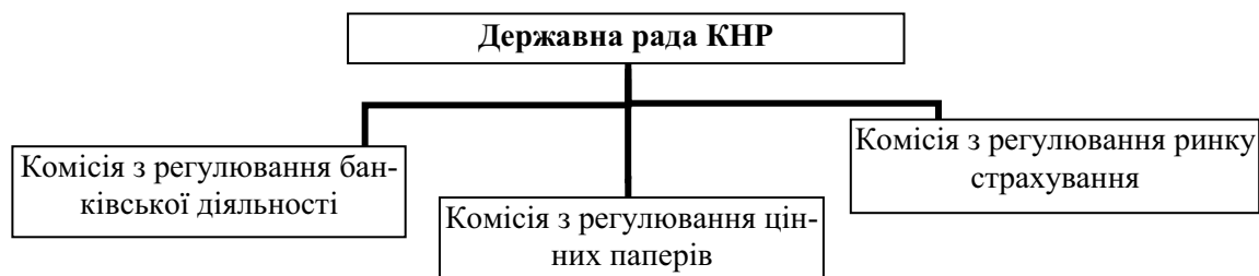
Рис. 4. Модель фінансового регулювання у КНР.

На даний момент для макропруденційного аналізу регуляторні органи Китаю використовують такі агреговані мікропруденційні показники: загальні показники діяльності установ, що відображають динаміку активів, кредитів і депозитів, індикатори безпеки (адекватність капіталу, якість активів, концентрація кредитного портфеля), показники ліквідності та прибутковості. Даний аналіз доповнюється дослідженням контрольних точок банківської системи у цілому, а саме: доля міжбанківського кредитування, відсоток офшорного фінансування, співвідношення сукупного кредитування до суми депозитів. У Китаї макропруденційний аналіз включає також такі макроекономічні фактори: розмір і темп зростання ВВП, інфляція, грошові агрегати, сальдо поточного балансу, розмір зовнішнього боргу та міжнародних резервів, динаміку валютного курсу [9].