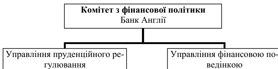
Рис. 3. Модель макропруденційного регулювання у Сполученому Королівстві.

Державне Казначейство Сполученого Королівства, Банк Англії з новоствореним Комітетом з фінансової політики займаються питаннями стійкості фінансової системи на макрорівні. Також були утворені дві нові інституції регулювання фінансового сектора (рис. 3). Підґрунтям реформ можна вважати теорії поведінкових фінансів. Як ми бачимо, обрана структура регулювання відповідає моделі «подвійного піку» (twin peaks), тобто між двома державними органами розподіляється об'єкт нагляду не за секторальним (сегментальним) принципом, а за суттю процесів, що піддаються контролю даними установами.