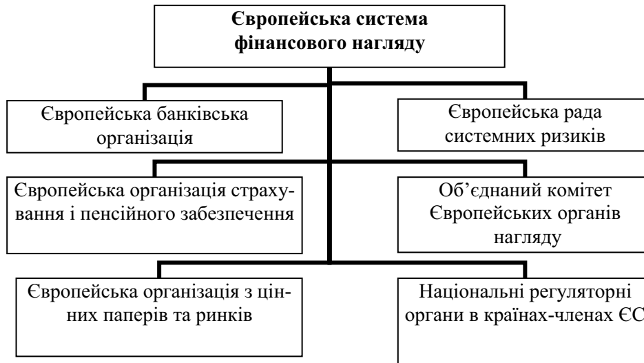
Рис. 1. Модель побудови макропруденційного регулювання у ЄС.

Останнім зі створених органів була Європейська рада системних ризиків, на яку покладаються такі функції: виявлення, оцінка і зниження вразливості, що виникають через взаємозалежності елементів фінансового ринку, а також макроекономічних та структурних змін [10]. Вважають, що основною перевагою нового регуляторного органу буде можливість швидкої адаптації та гнучкості реакції.