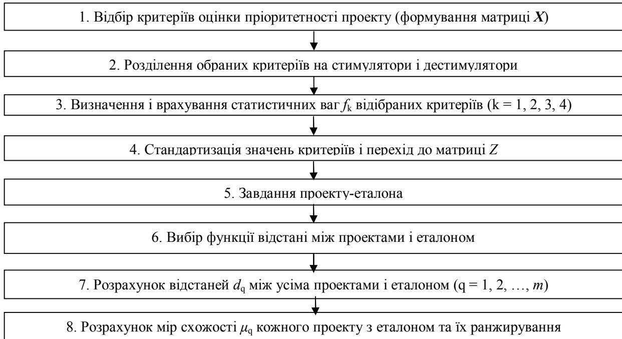
Рис. 2. Блок-схема класичного алгоритму таксономічного аналізу пріоритетності інвестиційних проектів.

Виходячи з наведеного теоретичного висновку, в подальшому в даній роботі будемо застосовувати в якості інструменту ранжирування інвестиційних проектів комерційної організації саме класичний варіант таксономічного аналізу, що забезпечує найбільш точне рішення поставленої задачі. Сутність його полягає у виконанні наступних основних етапів (рис. 2).