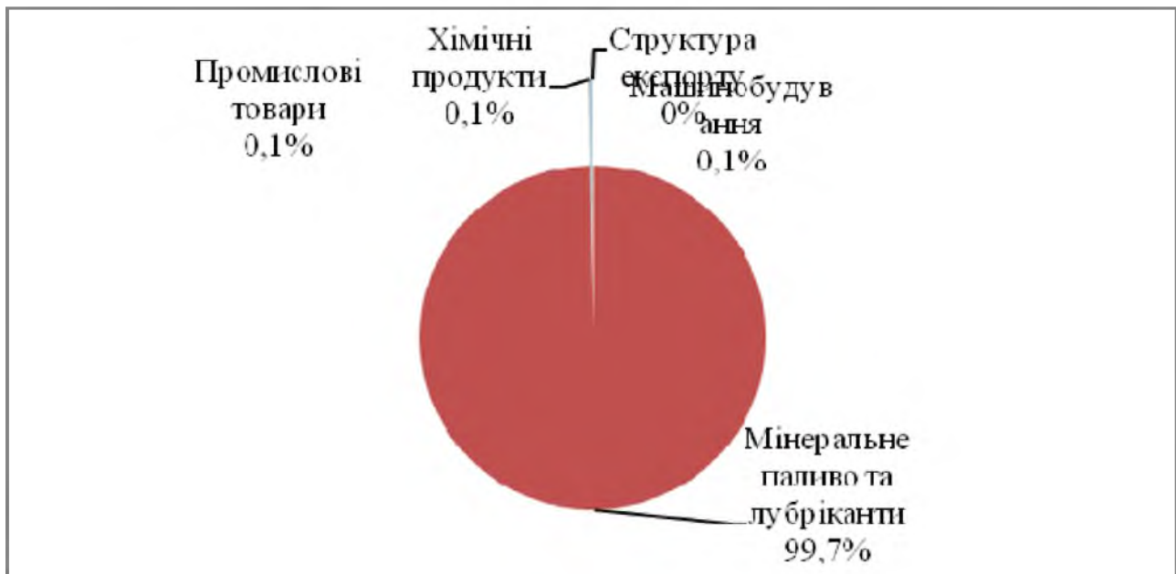
Рис. 2. Структура експорту Лівії до ЄС (2012 р.) [7].

Незважаючи на припинення переговорів щодо підписання угоди про зону вільної торгівлі з ЄС, торгівля має певні відмітні характеристики. Протягом тривалого періоду часу (з 2003 до 2008 рр.) експорт до ЄС інтенсивно збільшувався, через зростаючі потреби європейської економіки у енергоносіях. ЄС і досі залишається головним партнером Лівії. Першим спадом в двосторонній торгівлі є період світової фінансово-економічної кризи, після якого спостерігався підйом до подій Арабської весни 2011 р.