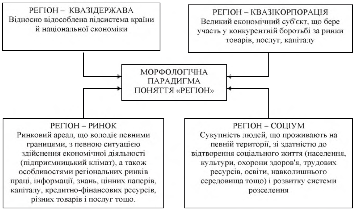
Рис.2. Морфологічна парадигма поняття «регіон» (розроблено автором)

Зміна реального позиціонування регіону у світовій економіці вимагає й зміни фундаментальних підходів, а також застосування нових методів і інструментів у практиці регіонального управління тощо. Однак, як показав аналіз наукової літератури, в теоріях регіонального розвитку і дотепер у багатьох роботах з регіонознавства й регіональної економіки регіон визначається переважно як об'єднання в рамках конкретної території населення й природних ресурсів, виробництва й споживання товарів, сфери обслуговування, не сприймаючись при цьому як носій особливих економічних інтересів. Ряд інших сучасних теорій (рис. 2.) розглядає регіон як багатоаспектну й багатофункціональну систему, що відрізняється функціональними ознаками. Однак і вони не створюють досить надійну теоретичну базу для побудови адекватної сучасним вимогам і тенденціям розвитку теорії управління економічною безпекою регіону, що враховує особливості функціонування соціально-економічної системи України в територіальному аспекті.