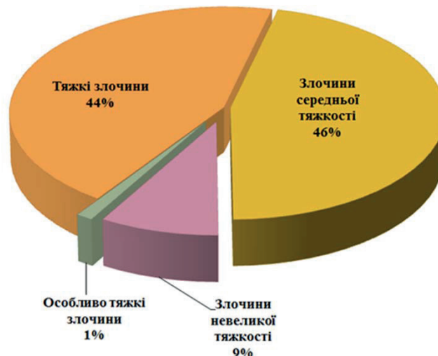
Рис. 1. Кримінальні правопорушення, вчинені неповнолітніми або за їх участю у 2014 році (за ступенем тяжкості)

Згідно з даними Єдиного звіту Генеральної прокуратури України про кримінальні правопорушення по державі за січень-грудень 2014 року, до суду було направлено 7467 кримінальних проваджень щодо кримінальних правопорушень, скоєних неповнолітніми або за їх участю. З них особливо тяжких – 89, тяжких – 3304, середньої тяжкості – 3440, невеликої тяжкості – 634 [4]. В процентному співвідношенні зазначені показники наведені на рис. 1.