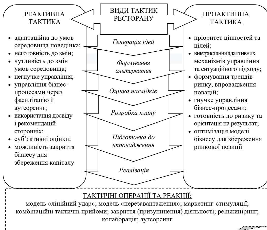
Рис. 1. Теоретичний інструментарій формування ресторанних тактик

тактику управління суб'єктами ресторанного бізнесу як сукупність управлінських рішень щодо удосконалення напрямів організації операційної діяльності ресторану (виробництво ресторанної продукції та надання споживачам сервісу у різних форматах); як комплекс організаційних цілей, завдань і технологій для реалізації стратегії розвитку ресторану через формування бренду та підвищення організаційних компетентностей. Тактика забезпечує конкурентні переваги ресторанів і дає змогу ефективно протидіяти поточним ризикам і загрозам, особливо пандемічним. Управління тактичними діями в ресторанному бізнесі під час локдауну включатиме певний теоретичний базис та методичний інструментарій (рис. 1).